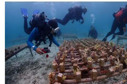
養殖場での研修（奄美大島視察団）