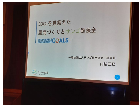
山城代表理事の講演スライド（草の根ツール会議）