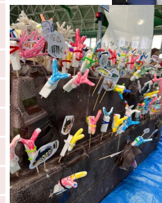
コザしん結マルシェ