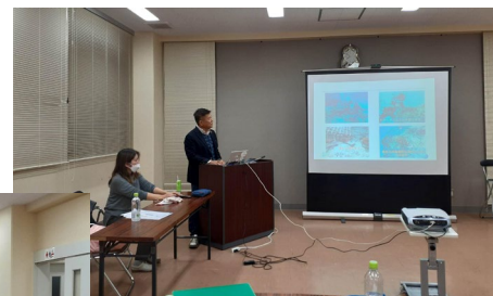
山城代表理事による講演