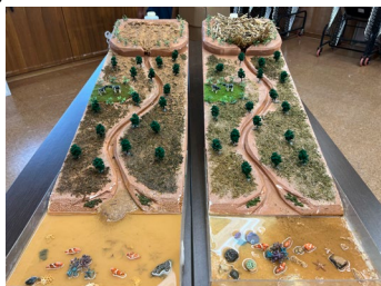
赤土流出に関する実験（奄美大島視察団）

パタゴニア主催の「恩納村におけるサンゴ保全活動に関する視察」の受入を行いました。