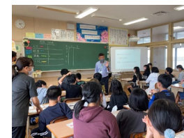
SDGs de 地方創生カードゲーム（恩納小学校）