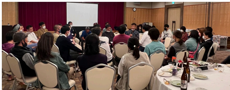
草の根ツール会議参加者との対話（話題提供者の一人とし山城代表理事が参加）