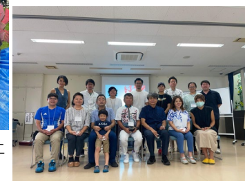
脱炭素まちづくりカレッジ