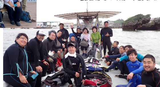
洋上研修（奄美大島視察団）