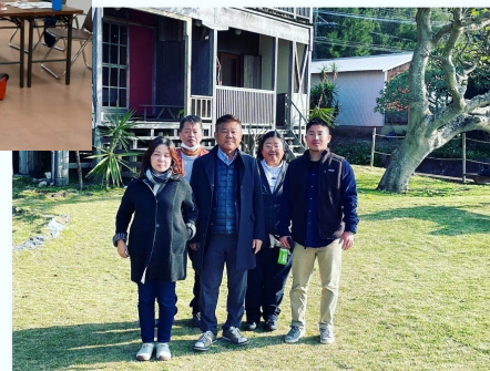
瀬戸内町の関係者との記念撮影