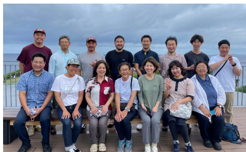
奄美大島視察団との記念撮影