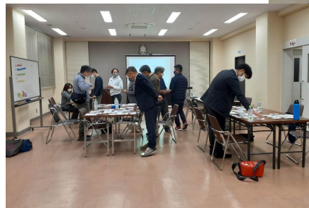
SDGs de 地方創生カード ゲーム体験会」

奄美大島にて、せとうち海を守る会の会員を対象に「SDGs de 地方創生カードゲーム体験会」の開催、瀬戸内町役場水産観光課への表敬訪問、パタゴニア主催の奄美大島におけるサンゴ保全活動に関するミーティングに参加しました。